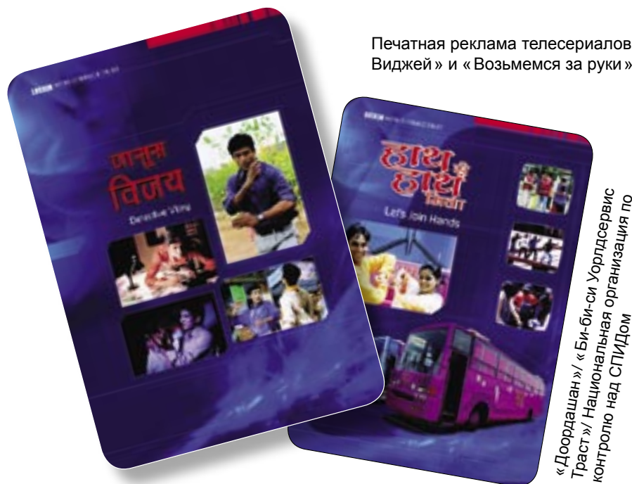
Печатная реклама телесериалов «Детектив Виджей» и «Возьмемся за руки», Индия.

Обе программы завоевали популярность у аудитории, а «Детектив Виджей» попал в номинацию «Лучший телесериал-триллер» на престижном мероприятии «Премии индийского телевидения» в 2003 году. Таким образом, зрители получали информацию о вирусе и способах защиты от него, и одновременно смотрели