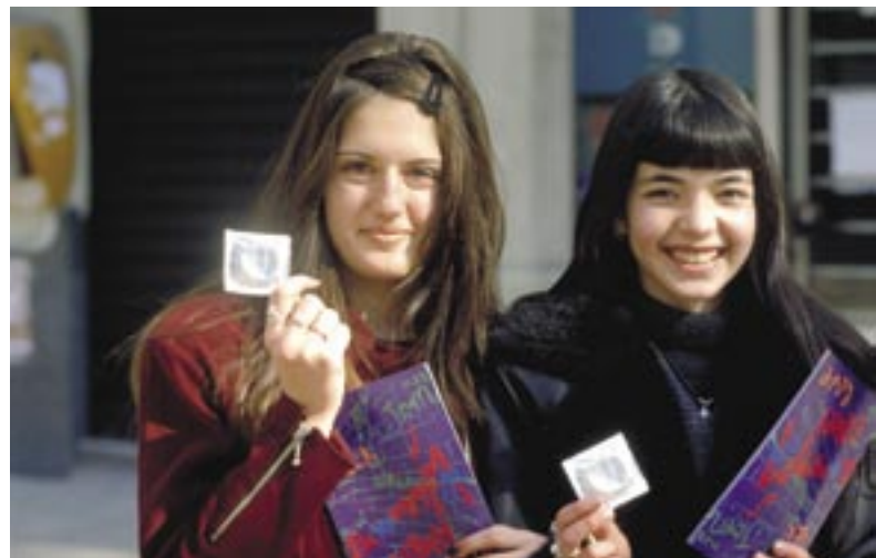
Мероприятия в рамках Всемирного дня СПИДа в Украине

Поразительно высоко число людей, особенно среди молодежи, которые просто никогда не слышали о ВИЧ . Так, например, в 21 африканской стране более 60% молодых женщин либо никогда не слышали о вирусе, либо разделяют минимум одно неверное представление о путях его распространения. В Лесото, стране с очень высоким уровнем распространенности ВИЧ-инфекции, только 2 из 10 девушек имели достаточные знания об этом. Хотя в Украине большинство молодых женщин слышали о ВИЧ/СПИДе, лишь 10% могли точно указать три основных способа, помогающих избежать инфекции: воздержание, верность партнеру и постоянное использование презервативов.