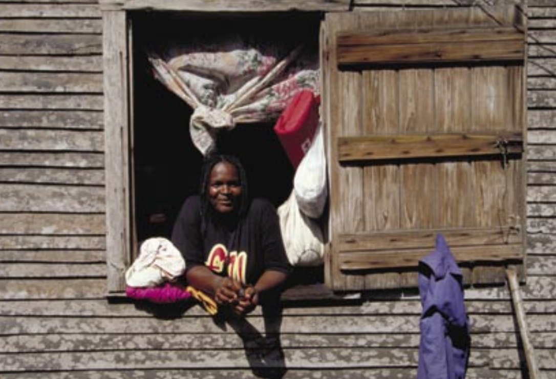
Женщины особо уязвимы к ВИЧ/СПИДу

делать для защиты от заражения, но не могут принять мер предосторожности из-за собственного бесправия, экономической зависимости от партнеров или страха перед насилием, если они откажутся заниматься сексом. Факты изнасилования также встречаются довольно часто. Около 50% молодых женщин в 9 странах Карибского бассейна указывают, что первый раз занимались сексом по принуждению.