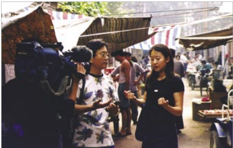
Съемки сериала «Простые люди». «Си-си-ти-ви», Китай.