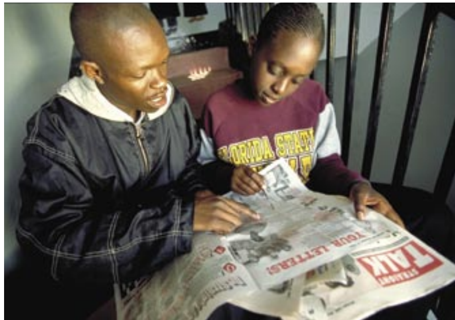
Молодые люди читают молодежную газету « Straight Talk » (« Откровенный разговор »), Кения.