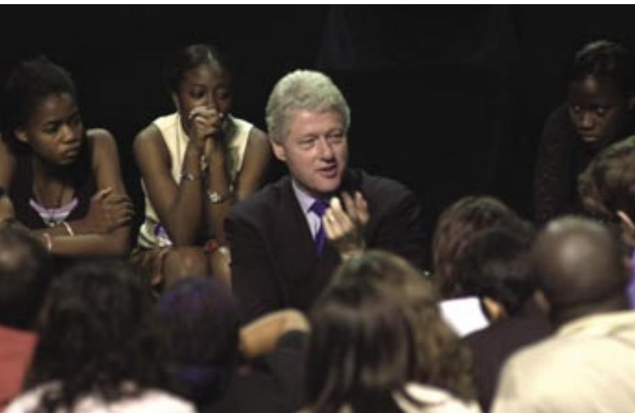
В рамках кампании «Остаться живым: Клинтон без «купюр»: бывший президент США Билл Клинтон обсуждает проблемы ВИЧ/СПИДа с молодежью.

Разумеется, проведение эффективных глобальных мероприятий в ответ на эпидемию СПИДа – дорогостоящее дело, как ясно и то, что на сегодняшний день в его обеспечение инвестированы