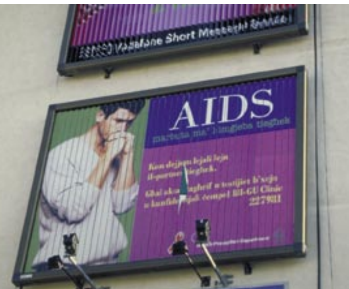
Информационный щит, разработанный Департаментом развития здравоохранения Мальты