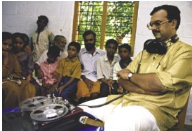
Пробное прослушивание радиосериала «Tinka Tinka Sukh» перед аудиторией в г. Керала, Индия.