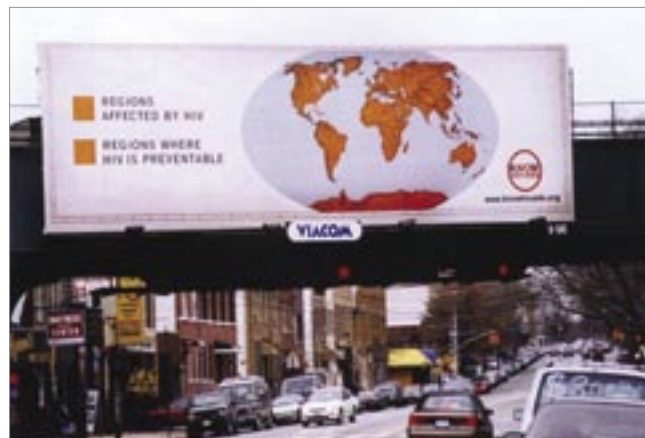
Рекламный щит кампании «ЗНАЙ о ВИЧ/СПИДе»

Достижение этой цели и существенное уменьшение глобальных последствий этой разрушительной эпидемии требует сотрудничества всех секторов общества: учебных заведений, правительства, религиозных организаций и средств массовой информации.